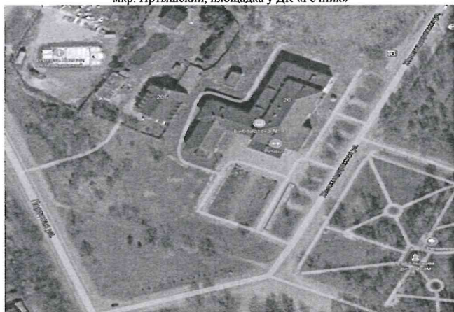
Схема размещения торговых мест на Ярмарке «Веселая масленица» мкр. Иртышский, площадка у ДК «Речник»