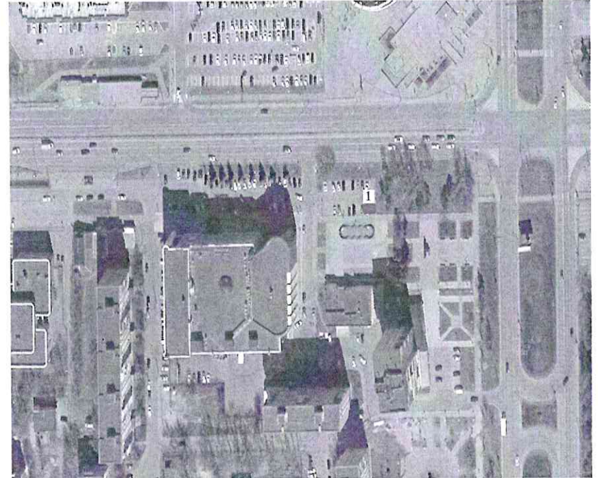
Схема размещения торговых мест на Ярмарке микрорайон 6, территория перед строением 53а (парковка)

Участнику предоставляется 1 торговое место (без оборудования и точки подключения)