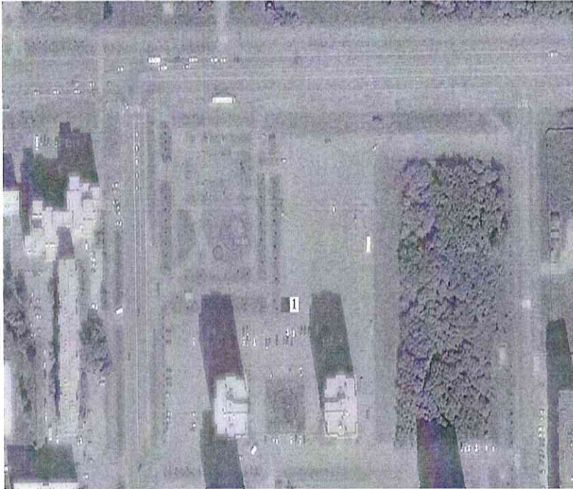
Схема размещения торговых мест на Ярмарке микрорайон 15, сквер «Семьи, любви и верности»

Участнику предоставляется 1 торговое место, оборудованное точкой подключения максимальной мощностью 4 кВт